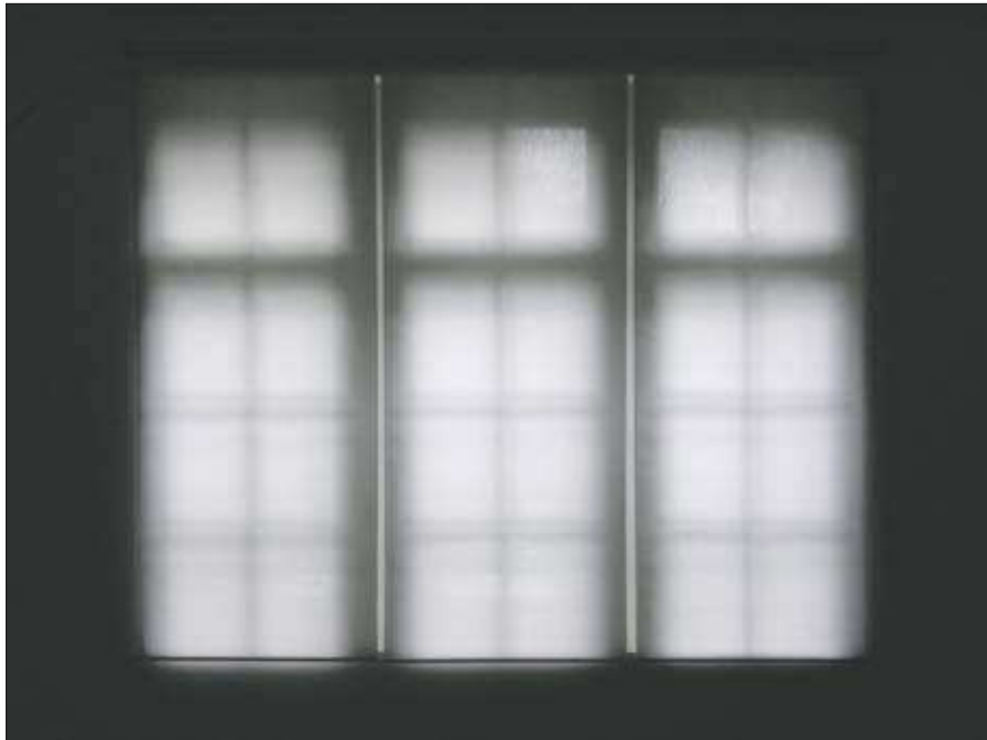
fenestra III 2011

Fotografie C-Print Diasec 75 cm x 100 cm