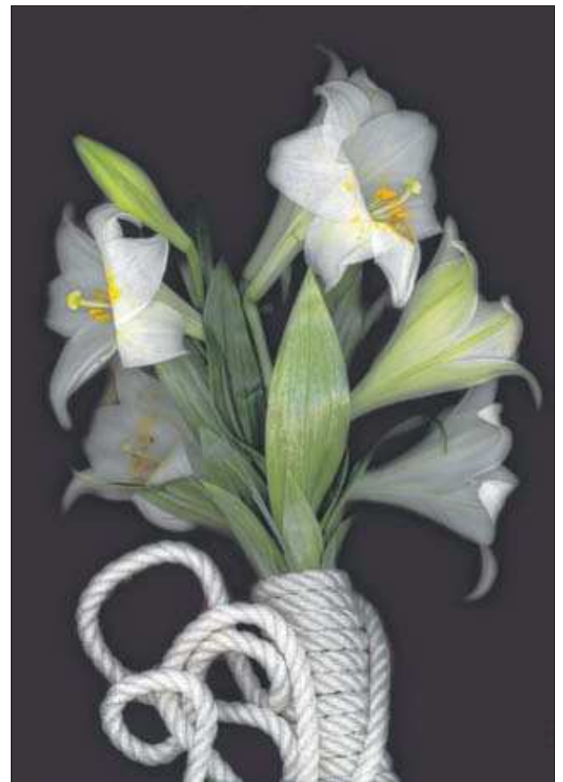
Lillies III 2012